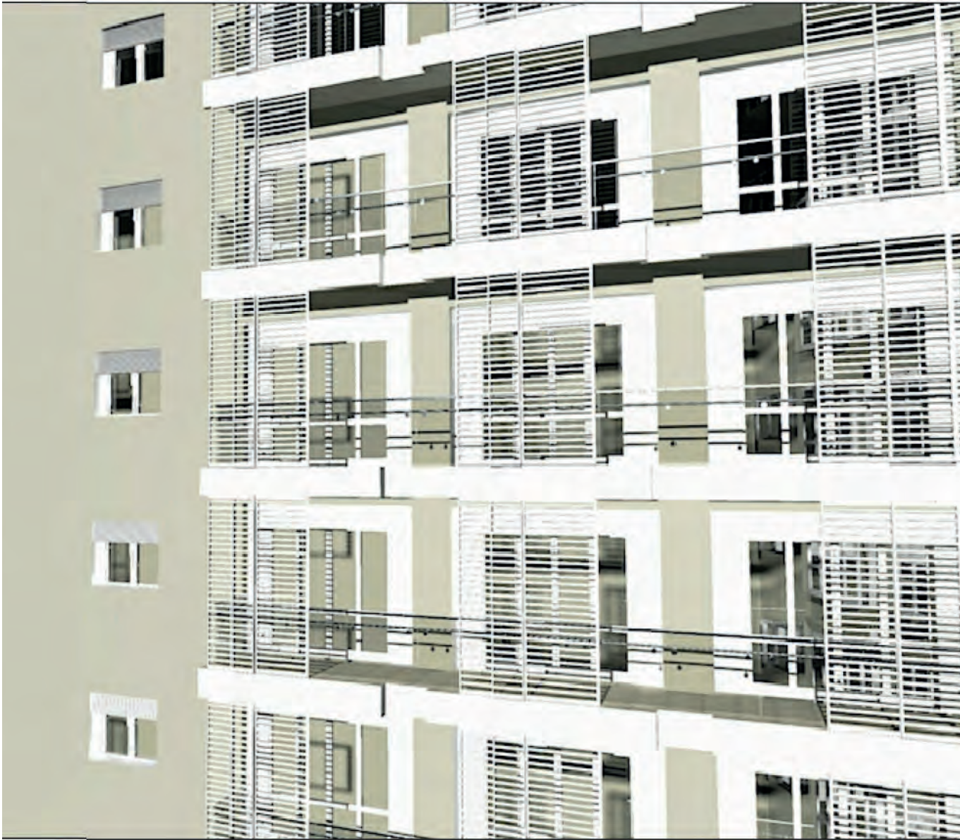
PARTICOLARE DEL PROSPETTO SU VIA ASIAGO STATO DI PROGETTO