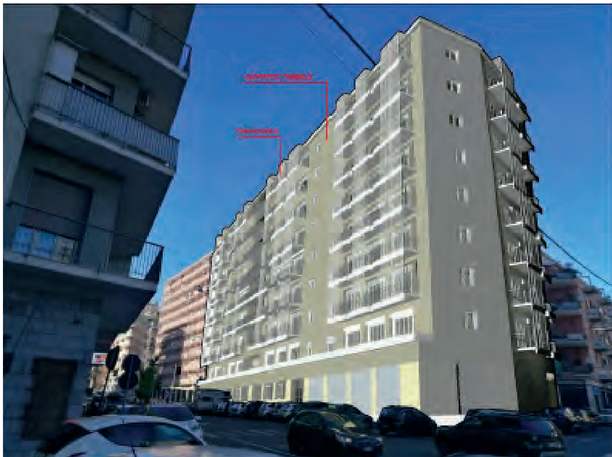
VISTA SU VIA ASIAGO ANG. VIA MESSINA STATO DI PROGETTO